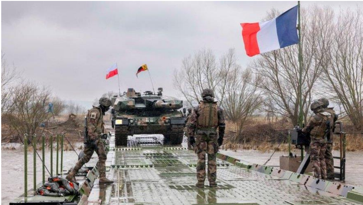
Manœuvre de l'armée de terre lors de l'exercice Dragon 24 en Pologne.

Accueil France - Monde International Guerre en Ukraine https://www.ladepeche.fr/ Publié le 21/03/2024 à 06:36 , mis à jour à 08:30 Cyril Brioulet