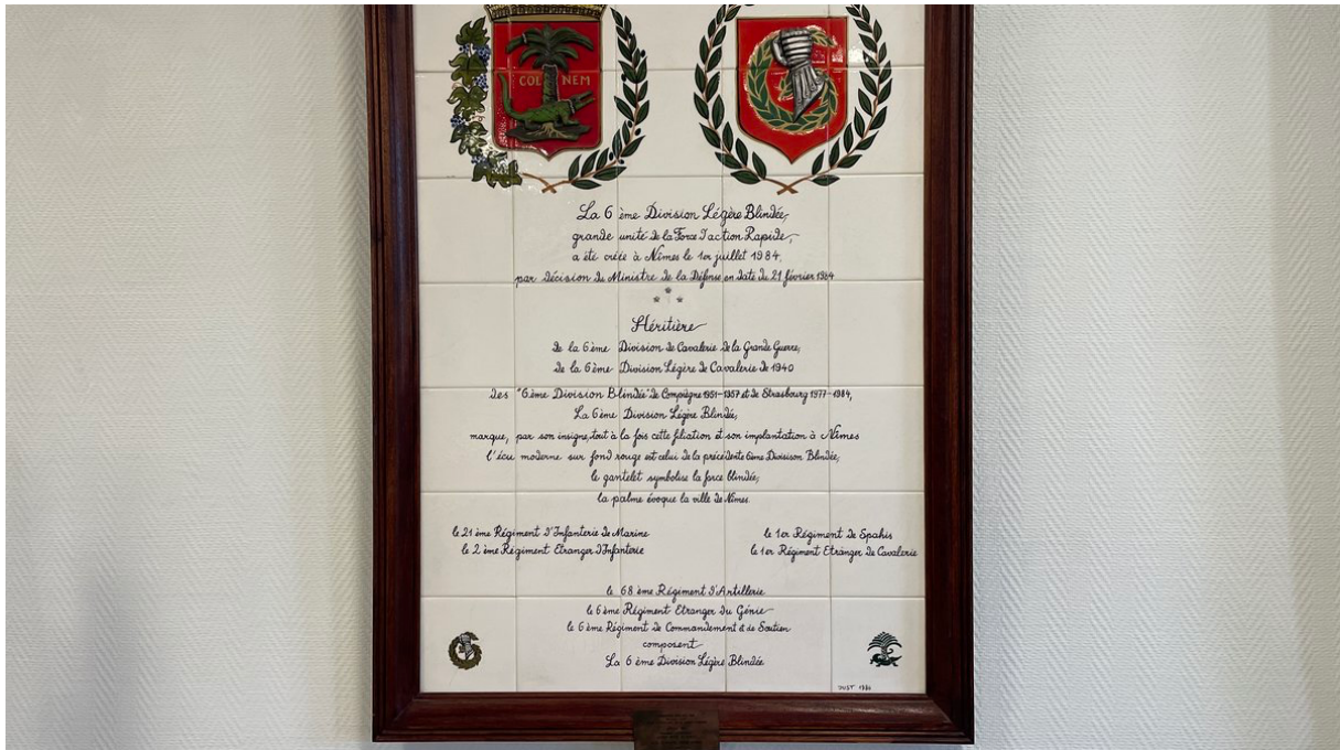
Les 40 ans 6e BLB auront lieu en 2024

Gardois seront les bienvenus pour rentrer en contact avec ces anges gardiens. « Tout sera ouvert au public, gratuit et le soir dans les arènes on aimerait 6 000 personnes ! » Le 40 e anniversaire de la 6 e Brigade légère blindée sera ainsi célébré le samedi 20 avril prochain. Aux arènes : concert, prise d'armes, démonstrations militaires, projection vidéo... Et en ville tout au long de la journée des animations et des présentations de matériels sans oublier quelques morceaux des fanfares militaires.