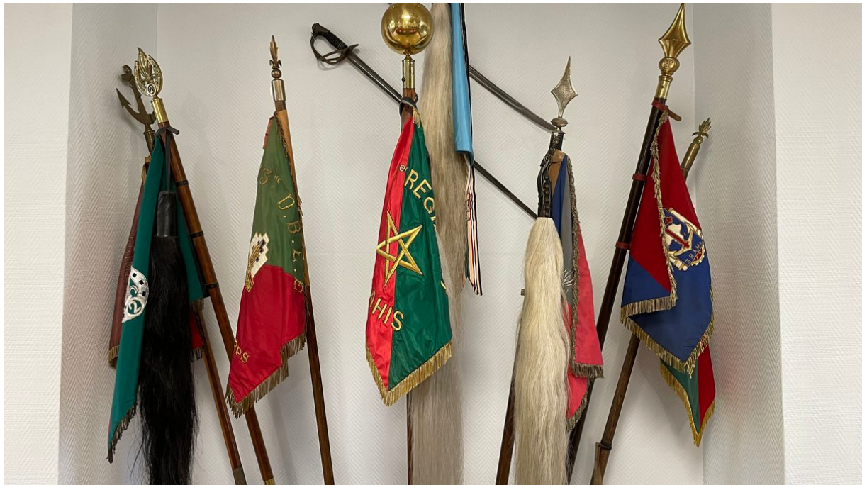
Les 40 ans 6e BLB auront lieu en 2024