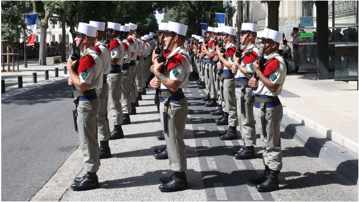
L'Armée en ville.