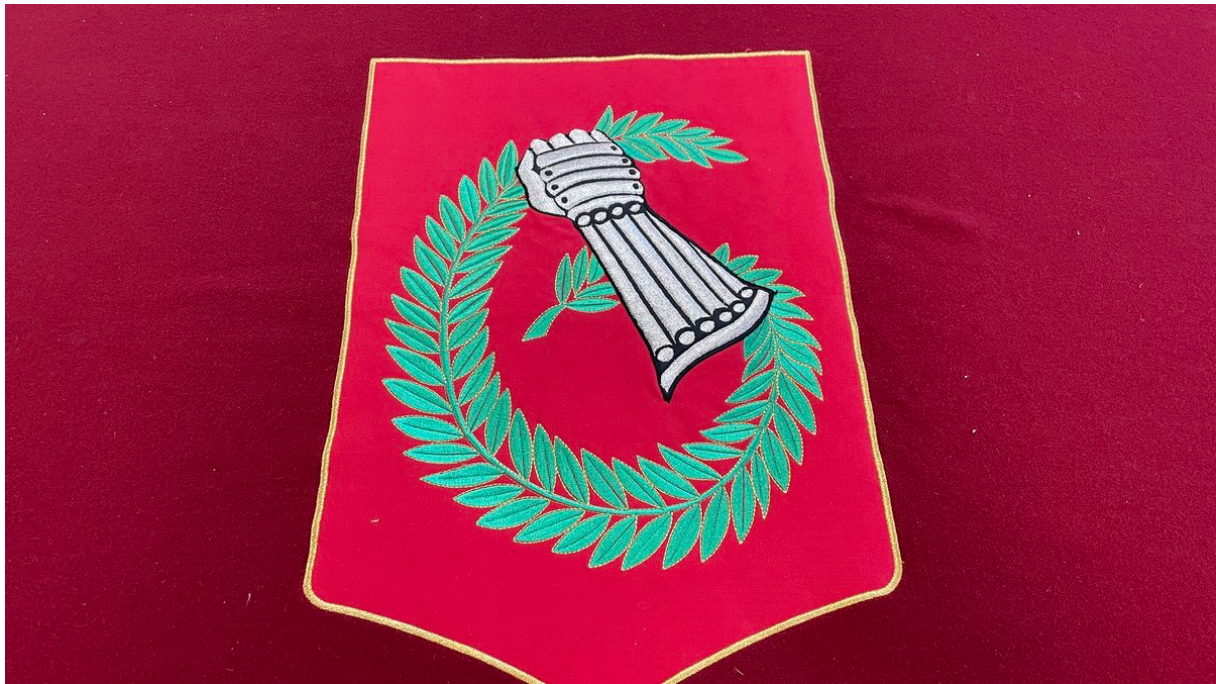
L'insigne de la 6e BLB