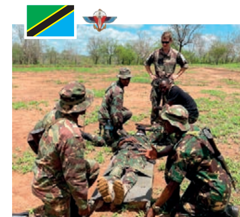
En Tanzanie, un détachement de 10 militaires du 2 e RPIMa forme une section d'un bataillon tanzanien.

Les légionnaires du détachement de Légion étrangère de Mayotte (DLEM) se sont eux rendus au Lesotho, royaume enclavé dans le territoire de l'Afrique du Sud, pour former une compagnie d'infanterie de la Lesotho Defence Force (LDF). Dans un second temps, un détachement du DLEM a formé 70 militaire seychellois d'une unité TAZAR afin de leur délivrer l'aptitude TIOR (technique d'intervention opérationnelle rapprochée) ainsi que le monitorat ISTC (instruction sur le tir de combat). ◀