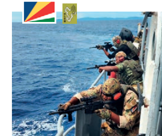
70 militaires seychellois sont formés par un détachement du DLEM.