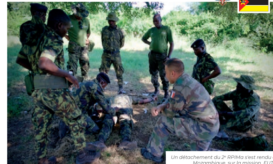
Un détachement du 2 e RPIMa s'est rendu au Mozambique sur la mission EUTM.

Dans le cadre de la coopération avec les acteurs de la sous-région, les unités des FAZSOI telles que le 2 e régiment de parachutistes d'infanterie de marine (2 e RPIMa) ou encore le détachement de la légion étrangère à Mayotte (DLEM) dispensent des instructions opérationnelles aux armées partenaires.