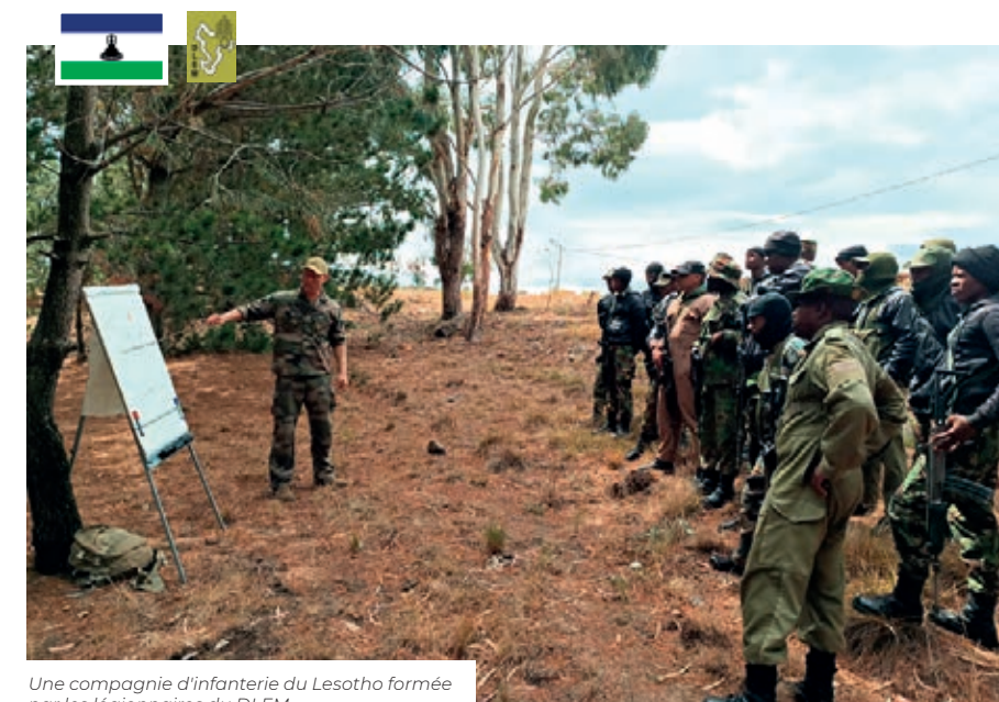
Une compagnie d'infanterie du Lesotho formée par les légionnaires du DLEM.