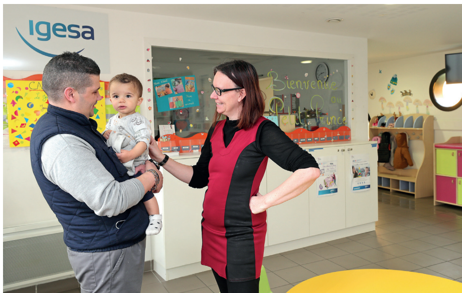
■ Un accueil chaleureux à la crèche Igesa de Salon de Provence.

Lancé en 2023, le deuxième volet du plan Famille met en œuvre trois axes stratégiques majeurs. Tout d'abord, il vise à accompagner la mutation du militaire et de sa famille, en tenant compte des spécificités liées aux changements fréquents de lieu de résidence. Ensuite, il cherche à atténuer les impacts des contraintes opérationnelles en offrant un soutien adapté aux familles. Enfin, le plan s'engage à améliorer le quotidien des familles dans les territoires, en renforçant notamment les liens avec les collectivités locales et en recentrant les actions sur les besoins concrets du quotidien.