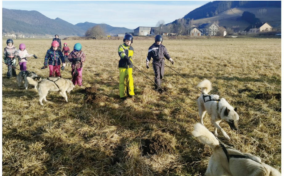
Les enfants de MEFARE ont pu profiter d'une expérience inoubliable lors de leurs colonies de vacances à Méaudre.